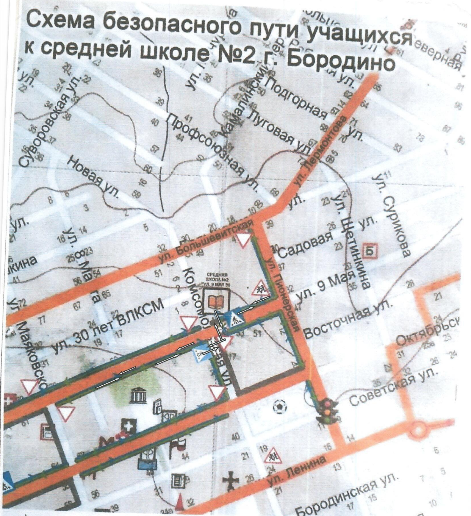
Схема безопасного пути учащихся к средней школе №2 г. Бородино